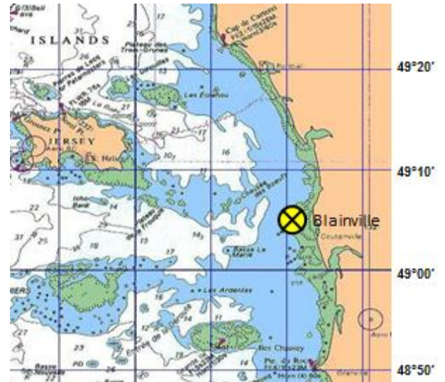
Figure 2 : Localisation du cantonnement de Blainville sur mer.

Le Comité Régional des Pêches Maritimes (CRPMN) de Normandie et le SMEL organisent une campagne de pêche scientifique pour évaluer la ressource de crustacés et en particulier de homards dans le cantonnement de Blainville sur mer. Cette opération s'effectue avec l'accord de la DIRM (Direction Interrégionale de la Mer).